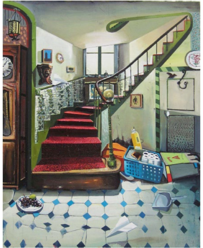
Mathieu Cherkit, Step by step , 2011, huile sur toile, 200 x 160 cm.

molle aux arguments galvaudés sonne comme l'aveu cynique de son impossibilité dans le monde contemporain et particulièrement dans le champ de l'art. Loin de dresser le portrait d'une peinture qui ne se prene pas au sérieux, cette génération de peintres a une conscience historique aiguë de son art, qui se reflète dans la réappropriation de grands sujets picturaux (le casting de Saints et de martyrs est impressionnant) et dont l'ambition se mesure à la taille des châssis. Le peintre solitaire, plongé dans la nuit de l'atelier par